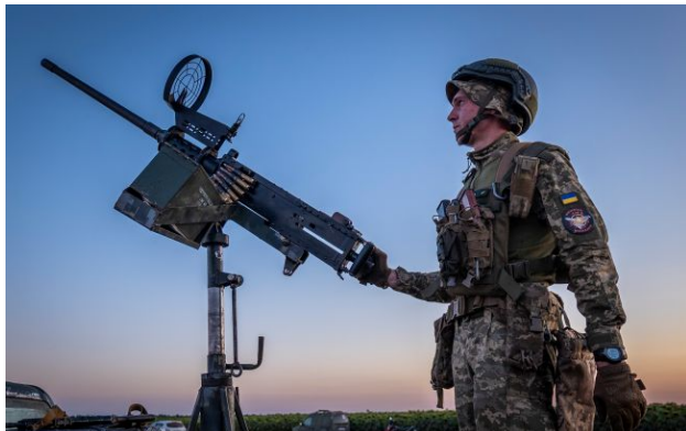
Фото: як спрацювала українська ППО під час масованої атаки (Getty Images)

Обирайте перевірене - додайте РБК-Україна до улюблених джерел у Google