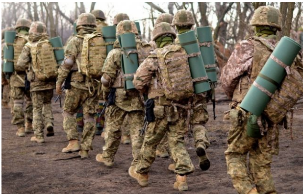
Фото: українські військові (facebook.com/AFUkraine)

Обирайте перевірене - додайте РБК-Україна до улюблених джерел у Google