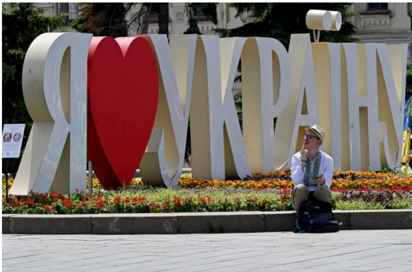
На Україну насувається комфортне потепління