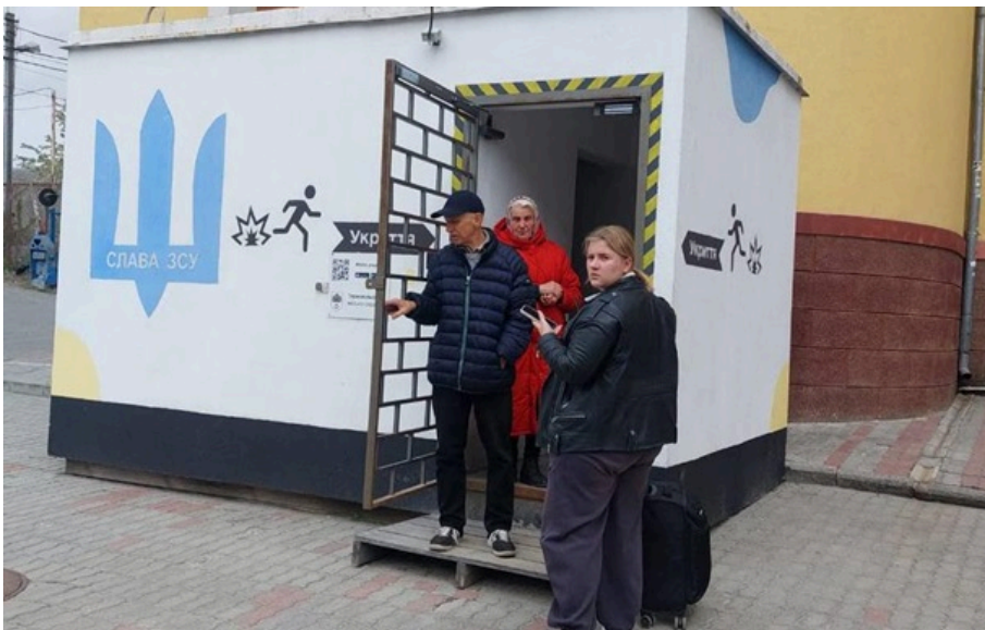
У міста можуть бути небезпечні уламки, попередила місцева влада

Частина мікрорайонів перебуває без електроенергії, ремонтні бригади працюють над відновленням.