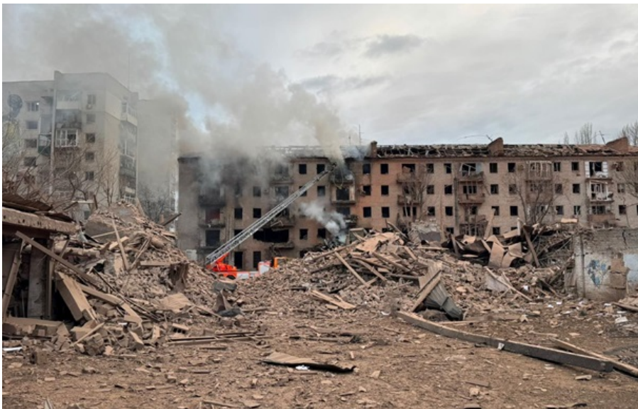
Наслідки російського авіаудару по Слов'янську

Наразі відомо про одного пораненого 57-річного чоловіка. Його готують до перевезення у клініку Дніпра.