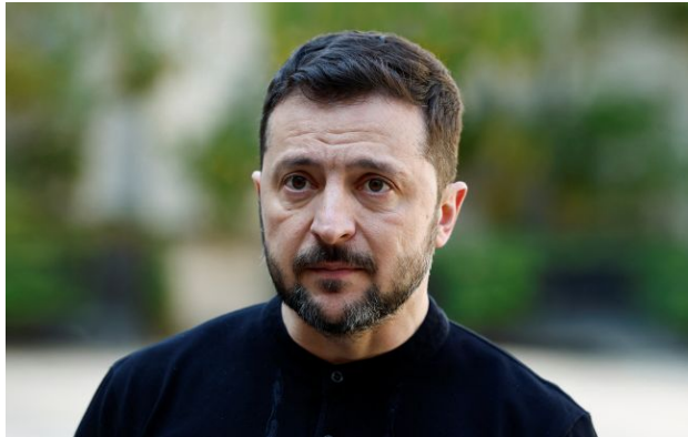
Фото: Володимир Зеленський, президент України (Getty Images)

Обирайте перевірене - додайте РБК-Україна до улюблених джерел у Google