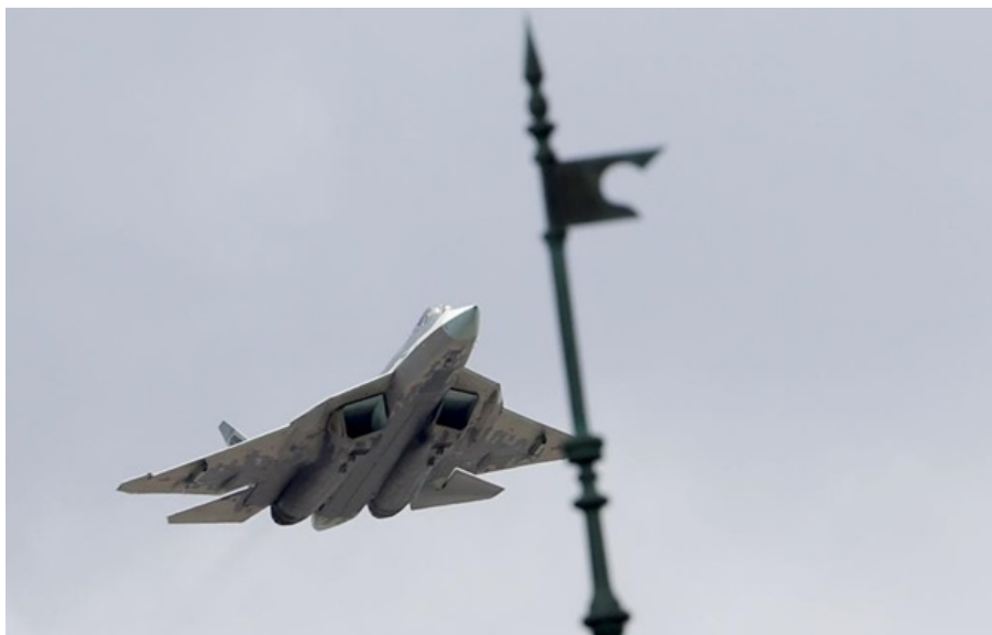
Су-57 летить над Кремлем

Важливі цілі знаходились на аеродромі Шагол у Челябінській області РФ на відстані близько 1700 км від держкордону України.