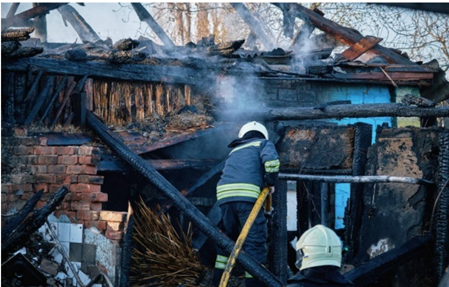
Наслідки дронавої атаки РФ на Черкаси

Пошкоджені десятки приватних будинків, автомобілі. Постраждали четверо людей, двох з них госпіталізували.