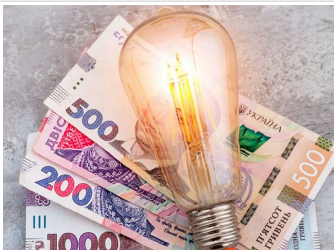
Тариф 4,32 гривень залишається: Свириденко пообіцяла стабільність ціною 170 мільярдів бюджетних гривень

Тарифи на світло для населення залишаться без змін, 4,32 грн/кВт. Принаймні до 1 листопада.