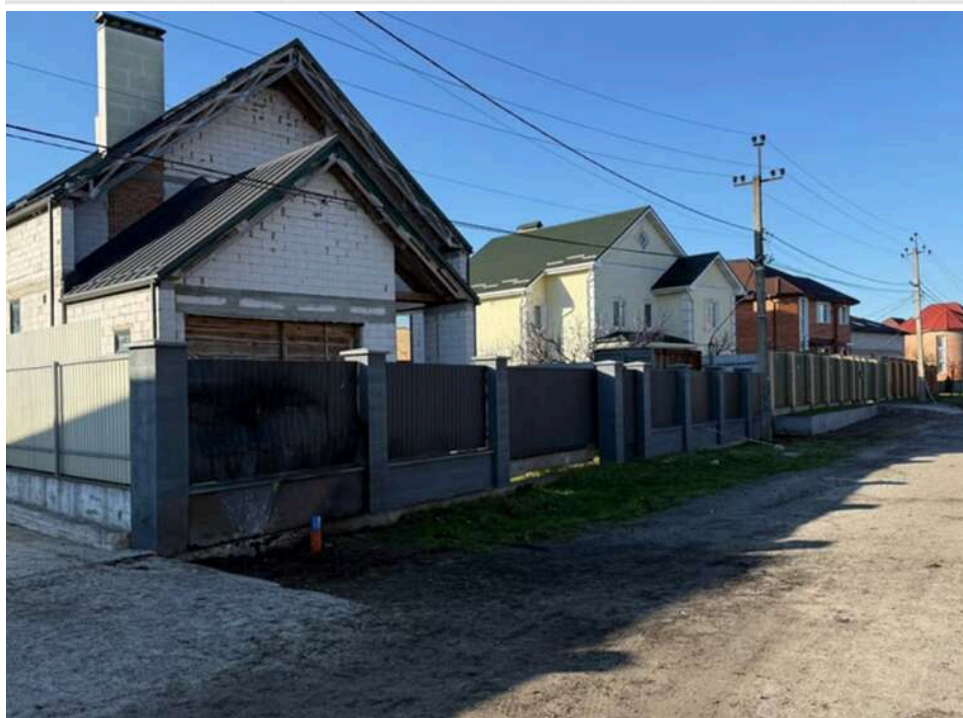
Вибух біля приватного будинку в Броварах: підозрюваного в теракті затримали на Вінниччині під час спроби втекти за кордон

У Броварах Київської області ввечері понеділка, 13 квітня 2026 року, біля приватного будинку пролунав вибух, кваліфікований як терористичний акт. За даними слідства, вибухівку було закладено заздалегідь і активовано дистанційно. Унаслідок події постраждав 36-річний чоловік. Поліцейські швидко затримали двох підозрюваних, один з яких намагався покинути Україну.