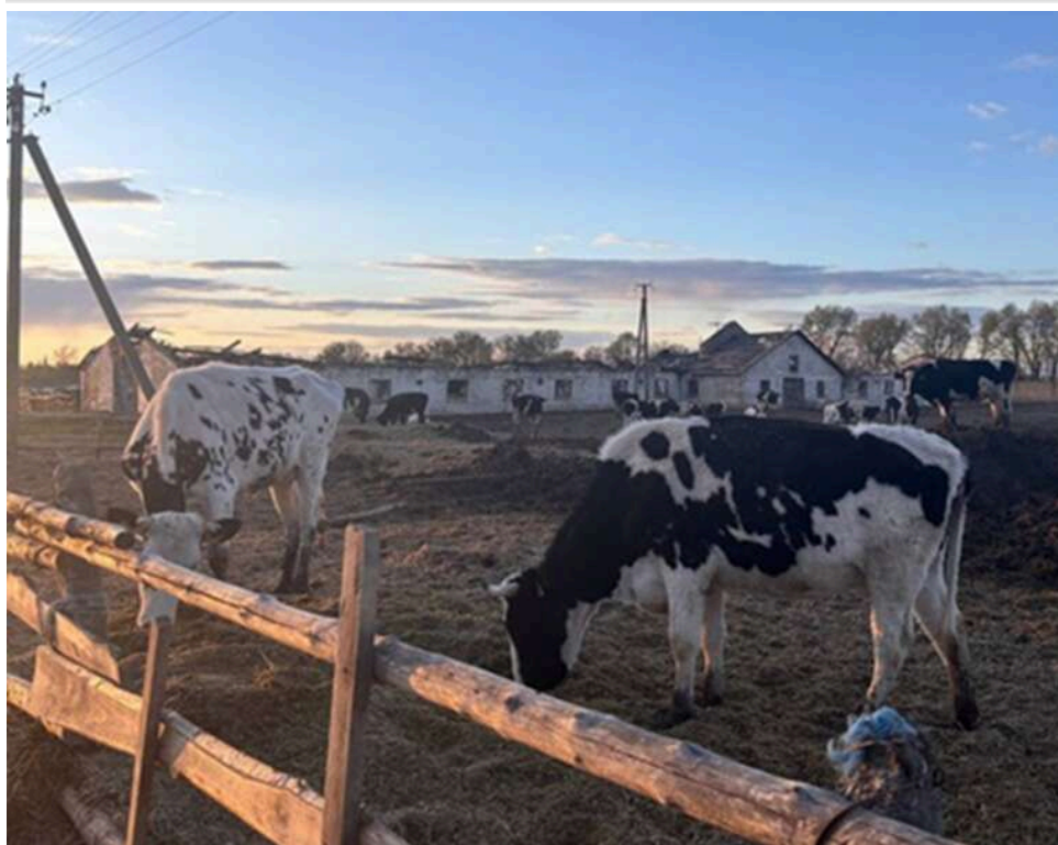
Спалах пастерельозу на Житомирщині: на держпідприємстві «Рихальське» виявили тіла корів та ознаки інфекції

На державному підприємстві «Рихальське» у Житомирській області виявили тіла трьох мертвих корів. У однієї з тварин зафіксували ознаки пастерельозу – небезпечного інфекційного захворювання. Ще одну корову знайшли закопаною на території ферми.