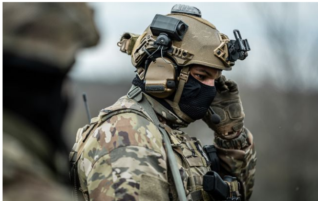
Фото: бійці спецпідрозділу ГУР (Getty Images)

Обирайте перевірене - додайте РБК-Україна до улюблених джерел у Google