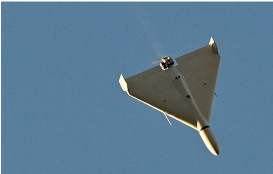
У Тернополі під час тривоги пролунали вибухи

Частина міста залишилася без електроенергії: частина мікрорайонів Канада, Центр, Новий світ та мікрорайон Старий парк, а також частина масиву Сонячний.