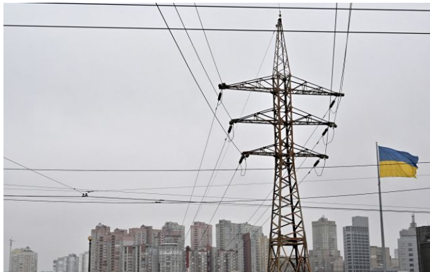
Борги на балансуєчому ринку можуть сягнути 50 млрд грн

Обирайте перевірене - додайте РБК-Україна до улюблених джерел у Google