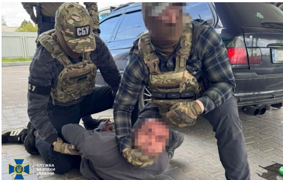
Правоохоронці викрили ще вісім "ухилянтських схем"

За 25 тисяч доларів ділки пропонували військовозобов'язаним уникнути призову через підроблені документи або допомагали втекти за кордон поза пунктами пропуску.