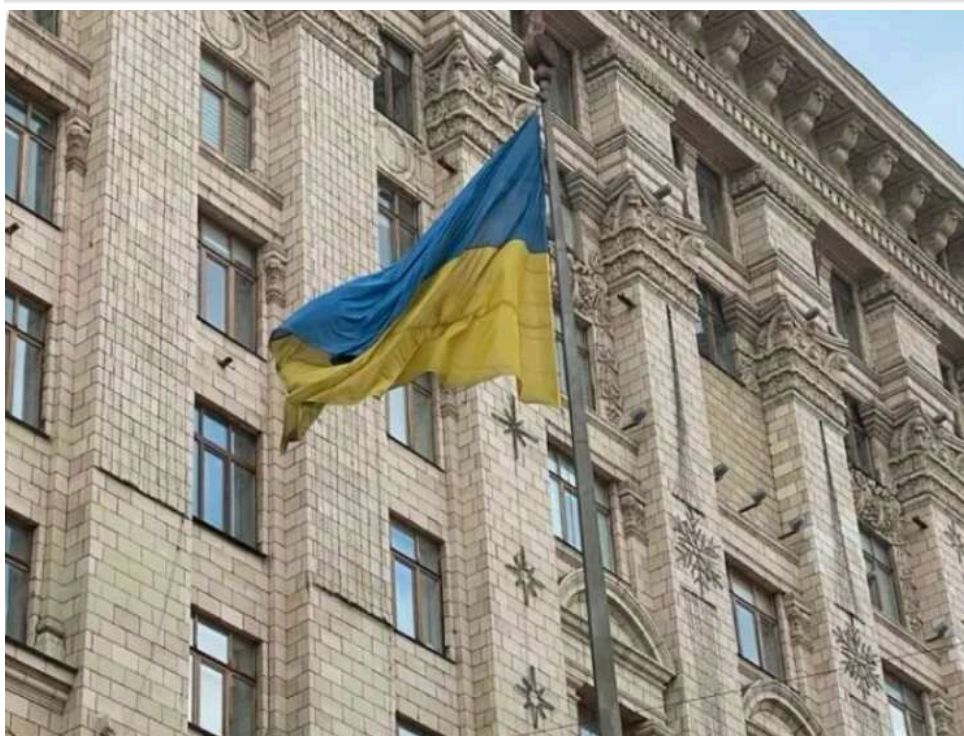
Потемнів після зими: над будівлею Київради майорить брудний державний стяг

Державний прапор України на флагштоці перед будівлею Київради на Хрещатику 36 перебуває у край занедбаному стані. Це особисто зафіксував кореспондент Інформатора під час огляду символів Хрещатика - синьо-жовте полотнище потемніло від зимового бруду та потребує негайної заміни. Стяг, що підіймається над центральним адміністративним будинком столиці, вже не відповідає жодним стандартам репрезентативності. Питання про те, хто несе відповідальність за стан державного символу над головною будівлею міської влади, залишається без відповіді.