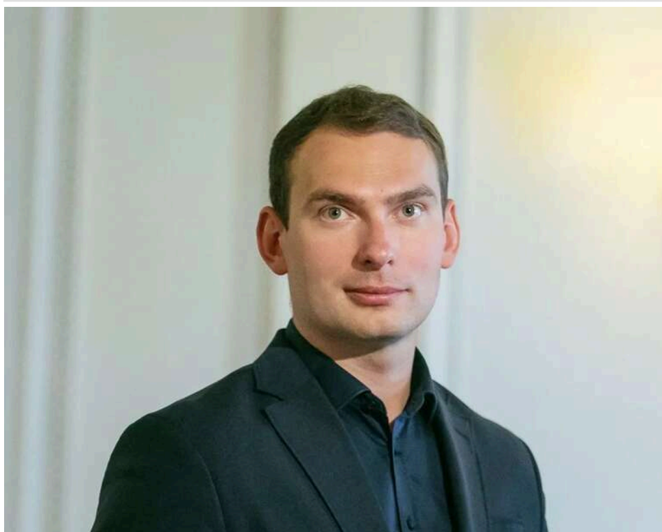
«Шмига» для розвалу та 200 мільйонів готівки: як Міндіч та Умеров «фільтрували» Кабмін

Народний депутат Залізник опублікував, за його твердженням, нову порцію аудіозаписів переговорів Міндіча з Умеровим, який на той момент обіймав посаду міністра оборони.