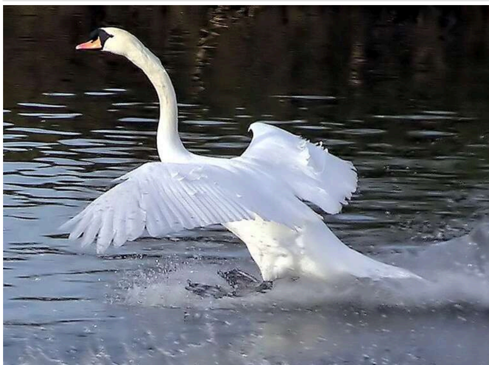
Під окупованим Генічеськом масово гинуть лебеді через незаконні рибальські сітки