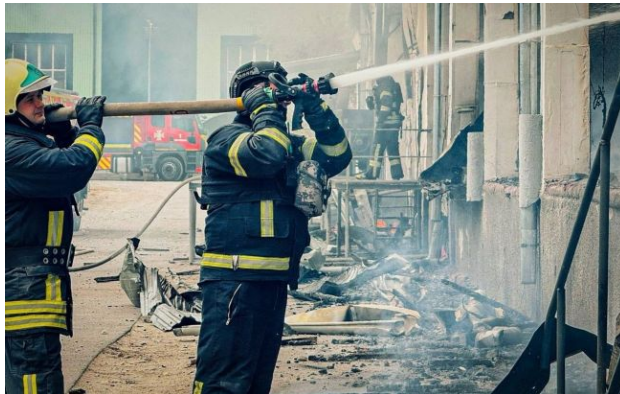
Фото: Тернопіль опинився під атакою "Шахедів" (t.me/dsns_telegram)

Обирайте перевірене - додайте РБК-Україна до улюблених джерел у Google