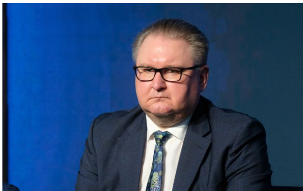
Фото: віцепрем'єр-міністр з питань європейської та євроатлантичної інтеграції Тарас Качка

Україна може за 12-18 місяців закрити більшість переговорних розділів щодо вступу до ЄС і вже у 2027 році перейти до підписання договору про членство.