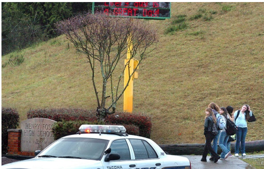
Фото: Getty Images (ілюстративне) Під час нападу постраждали п'ятеро осіб