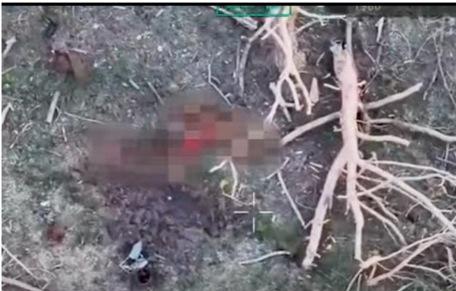
Військові показали знищення окупантів на Сумщині

Також військові повідомили, що село Корчаківка Сумської області перебуває під контролем ЗСУ, інформація про начебто його захоплення росіянами не відповідає дійсності.