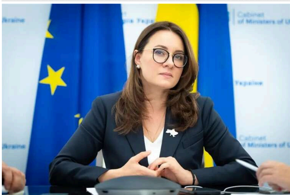
«Не знайома, не була»: Прем'єрка Свиріденко в Раді спростувала зв'язки з фігурантом «плівко» Міндічем

«Не знайома, не була»: прем'єр-міністерка Юлія Свиріденко заявила, що не знайома з бізнесменом Тимуром Міндічем – фігурантом справи НАБУ та САП, відкритої після операції «Мідас».