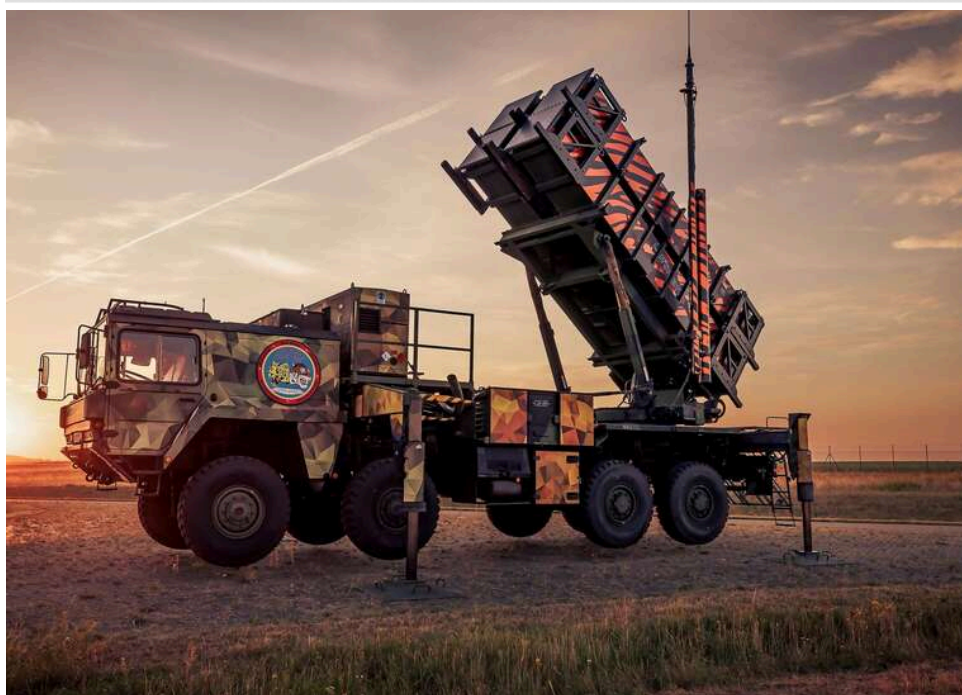
Одна ракета замість чотирьох: Україна змушена економити дефіцитні снаряди до Patriot через інтенсивні атаки РФ