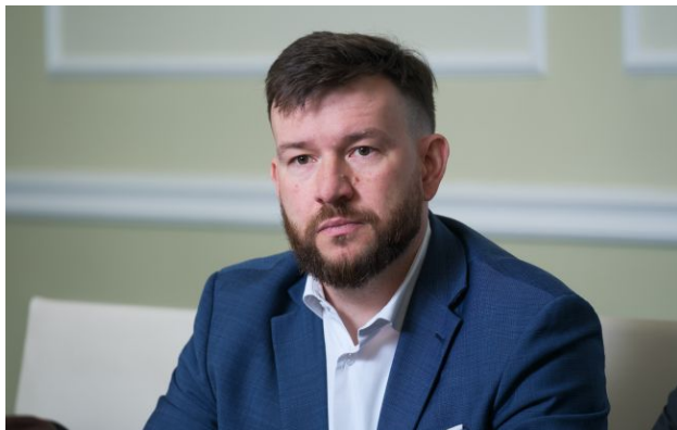
Фото: міністр соціальної політики України Денис Улютін (Віталій Носач, РБК-Україна)

Українці, які подали заявки ще в січні-лютому, досі не отримали виплатами допомоги при народженні дитини. Причина - технічна помилка.