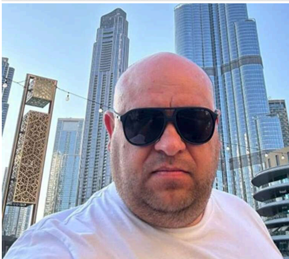
Схеми на 1,2 мільярда: групу Amber Galbin Олега Богельського підозрюють у масштабних махінаціях із бурштином та податками

У жовтні 2025 року на підприємствах групи компаній Amber Galbin, пов'язаної з Олегом Богельським, пройшли обшуки. Компанії підозрюють у незаконному видобутку бурштину та ухиленні від сплати податків на суму понад 1,2 мільярда гривень.