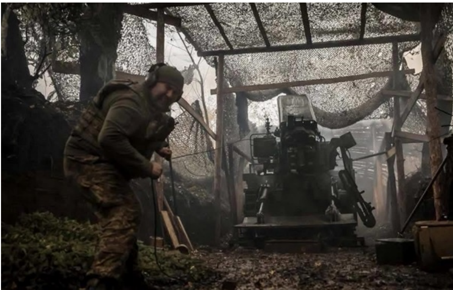
На Покровському напрямку українські захисники зупинили 42 штурмові дії агресора

Противник протягом минулої доби 12 разів намагався вклинитися в українську оборону на Лиманському напрямку.