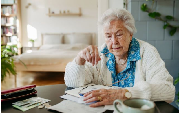
Фото: ПФУ спрямував більше коштів на виплату пенсій у квітні порівняно з березнем (Getty Images)

Обирайте перевірене - додайте РБК-Україна до улюблених джерел у Google