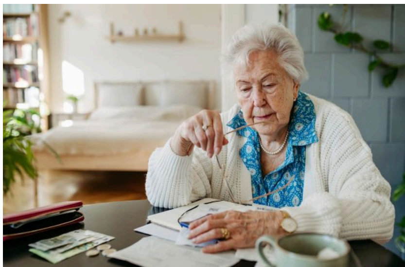
Фото: ПФУ спрямував більше коштів на виплату пенсій у квітні порівняно з березнем