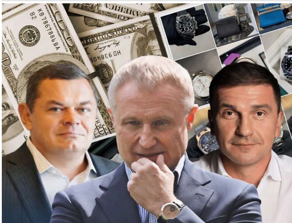
Rolex та Breguet під куполом Верховної Ради: Суркіс, Бондарєв та Борт очолили рейтинг найбільших колекціонерів люксових годинників

Менше від сотні народних депутатів задекларували наручні годинники.