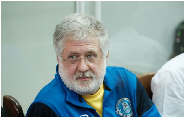
Фото: Ігор Коломойський

Служба безпеки України та Офіс генерального прокурора оголосили нову підозру бізнесмену Ігорю Коломойському. Його звинувачують у махінаціях з коштами ПриватБанку на 100 млн гривень.