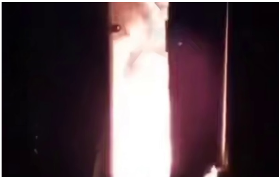
В селищі Свердловської області Гірський Щит було знищено телекомунікаційну шафу ключової вишки зв'язку