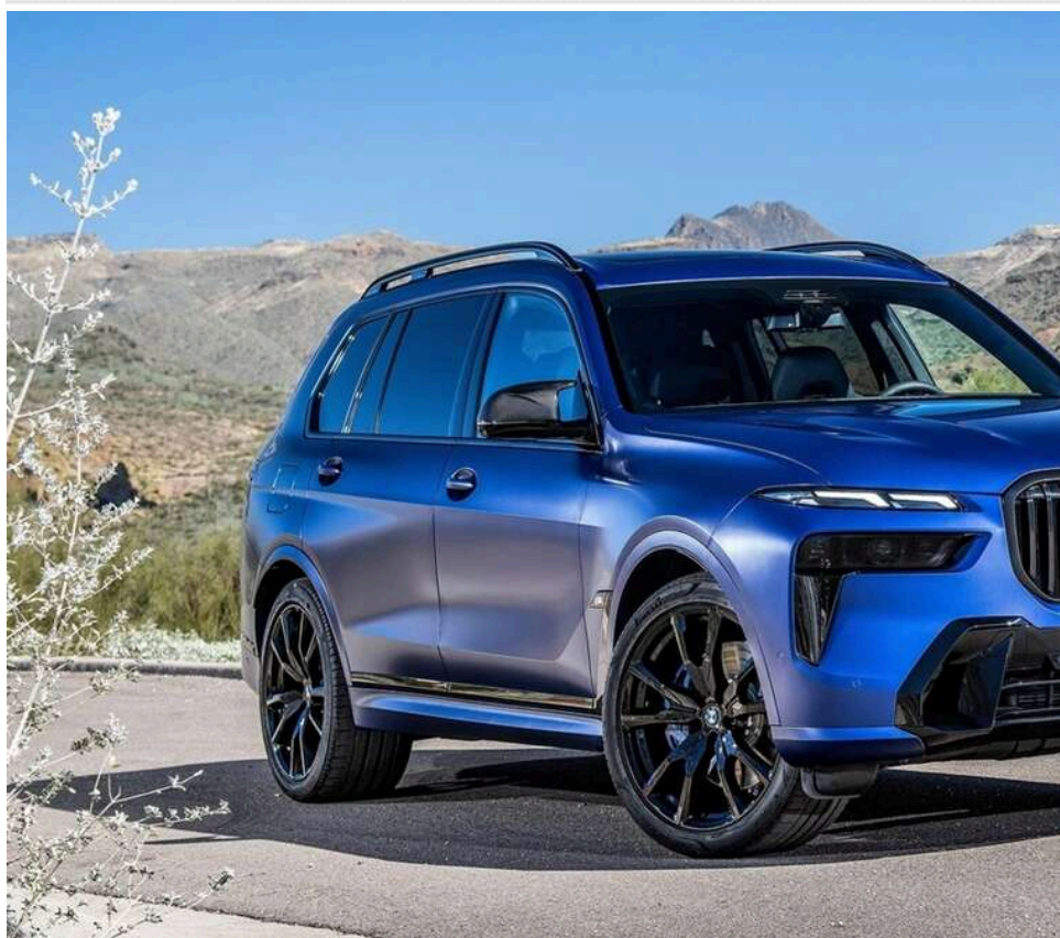
Пес проти BMW X7: в Одесі покарали водія, який намагався ввезти травматичний пістолет через кордон