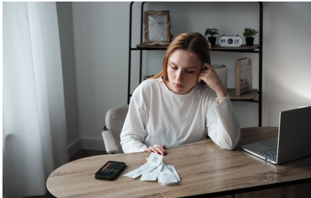
Фото: чи загрожує Україні економічна криза

Аналітики ІСУ переглянули очікування від української економіки у 2026 році. Через руйнування інфраструктури та скорочення бюджетних витрат темпи зростання будуть мінімальними.