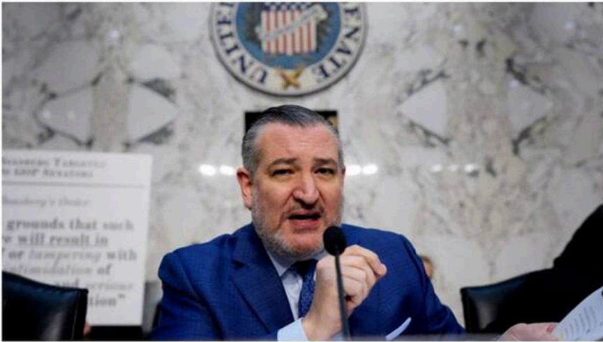
Sen. Ted Cruz.

Теги: Нападение России на Украину Напад Росії на Україну Война Війна США Конгресс США Конгрес США Госдеп США российские наемники Наемники Росія Россия Куба