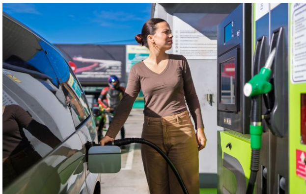
Фото: на популярних мережах АЗС вартість пального тримається на майже однаковому рівні (Getty Images)

Більшість популярних українських автозаправних станцій тримають ціники без змін. Водночас різниця у вартості на бензин А-95 на АЗС сягає 6 гривень на літрі залежно від мережі.