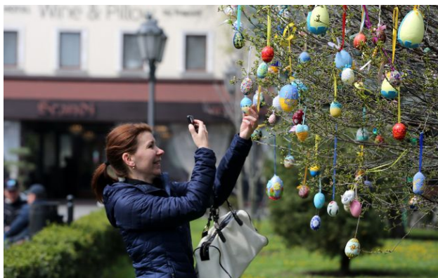
Фото: Великдень та Різдво є найпопулярнішими святами серед українців

Найпопулярнішими святами серед українців у 2026 році залишаються Великдень та Різдво.