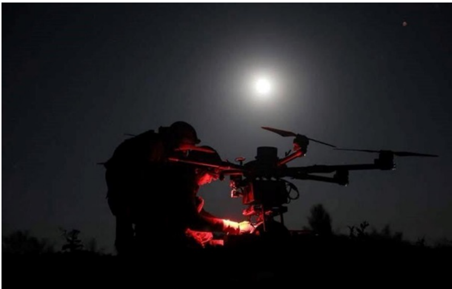
Станом на 07:00, протиповітряною обороною збито або подавлено 309 ворожих дронів

Повітряний напад відбивали авіація, зенітні ракетні війська, підрозділи РЕБ та БпС, а також мобільні вогневі групи СО України.