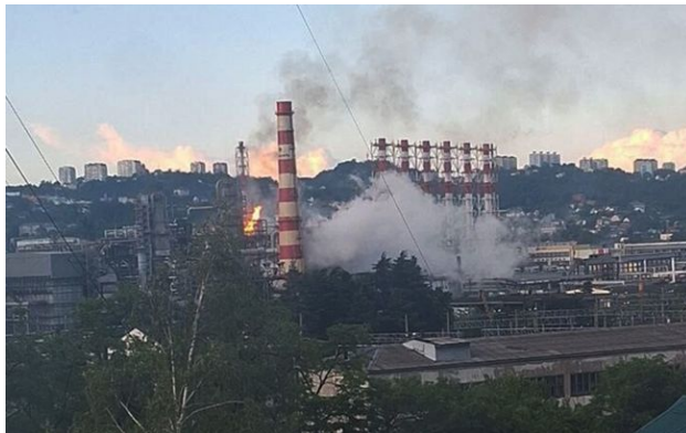
Фото: НПЗЗ у російському Туапсе атакували вчетверте (РосЗМІ)

Після четвертої атаки по нафтопереробному заводу в Туапсе у Краснодарському краю РФ в ніч на 1 травня його виробничі потужності знизилися.