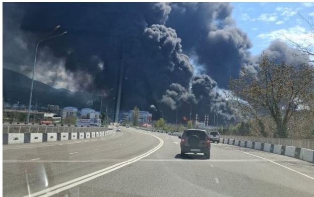
Фото: НПЗ у російському Туапсе атакували вчетверте (РосЗМ)

Обирайте перевірене - додайте РБК-Україна до улюблених джерел у Google