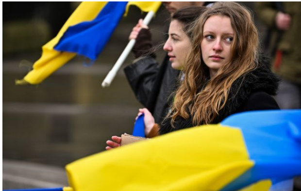
Фото: ставлення українців до травневих свят змінилося

Ставлення українців до травневих свят з 2010-го до 2026 року суттєво змінилося. День праці та День перемоги вже не вважаються важливими датами.