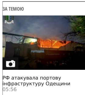
РФ атакувала портову інфраструктуру Одещини 05:56