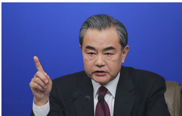
Фото: міністр закордонних справ Китаю Ван Ї (Getty Images)

Міністр закордонних справ Китаю Ван Ї під час розмови з державним секретарем США Марко Рубіо закликав Вашингтон "зробити правильний вибір" у питанні Тайваню.