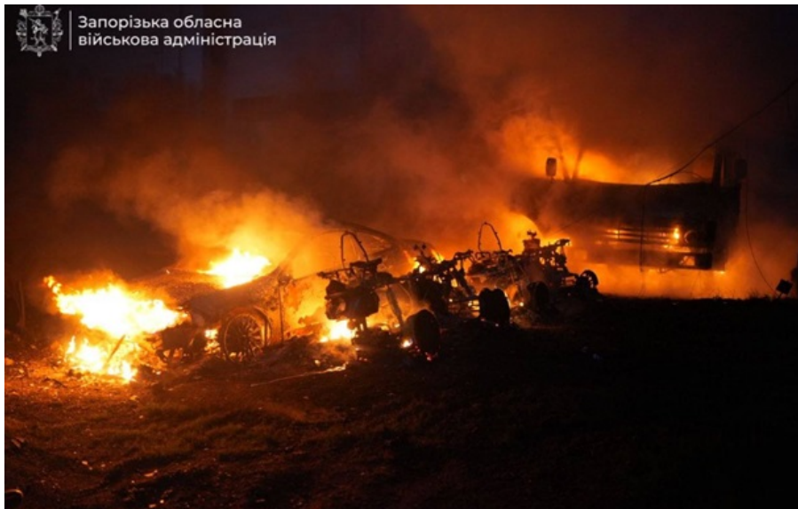
Наслідки ударів РФ по Запоріжжю

По області оголошували загрозу ударів безпілотників і швидкісних ракет. Загинула продавчиня кіоску.