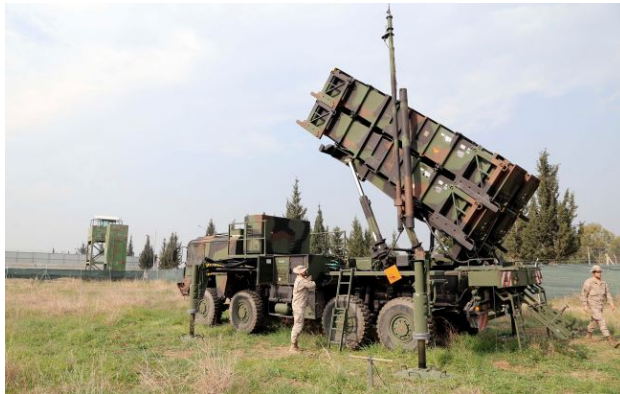
Фото ілюстративне: Японія послабила правила експорту зброї

Після рішення Японії послабити правила експорту озброєння відкрилася можливість для переговорів щодо майбутніх поставок військової техніки Україні.