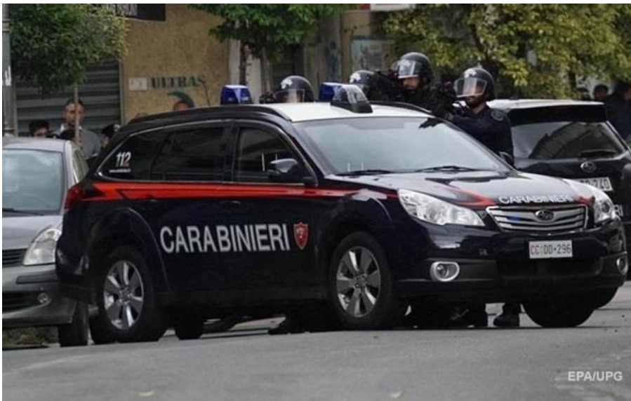
Затримали одного з найбільш розшукуваних мафіозі Італії

Ордер на арешт Роберто Маццарелли був виданий 28 січня 2025 року, але йому вдалося втекти.