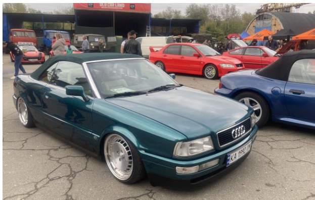
Фото: фестиваль OldCarLand пройде у музеї Колеса історії з 2 по 3 травня

Найбільший технічний фестиваль України OldCarLand пройде з 2 по 3 травня у Києві на території музею "Колеса Історії".