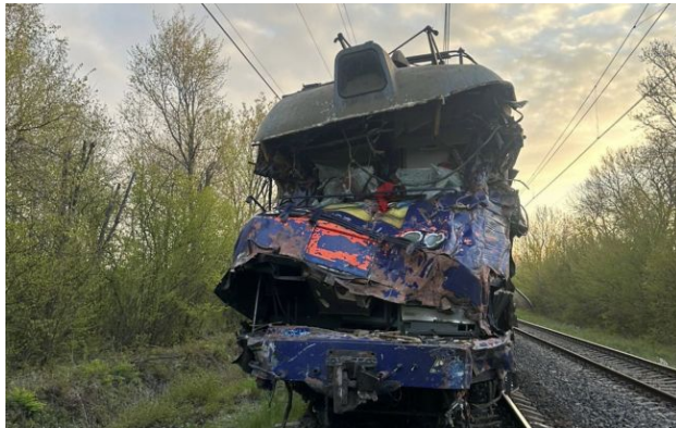
Фото: на Львівщині автокран врізався у поїзд

Обирайте перевірене - додайте РБК-Україна до улюблених джерел у Google