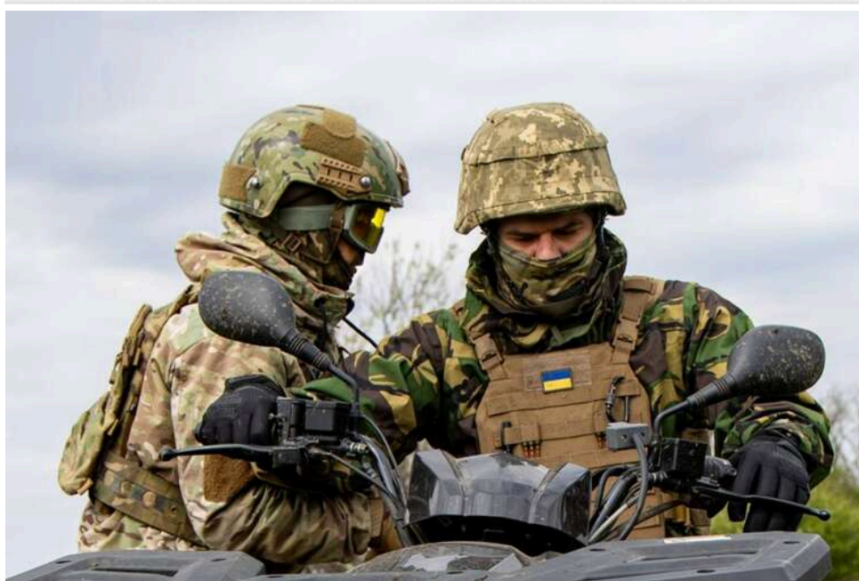
Ситуація на фронті: росіяни здійснили 40 атак і продовжують штурми на кількох напрямках

Станом на 16:00 14 квітня російська армія 40 разів атакувала позиції Сил оборони України.