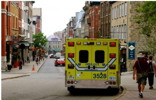
Фото: Частина медичних послуг стане платною для українців у Канаді

У Канаді відсьогодні, 1 травня, запроваджують нові правила оплати медичних послуг для біженців. Тепер частину витрат доведеться покривати самостійно, що вже викликає занепокоєння правозахисників.